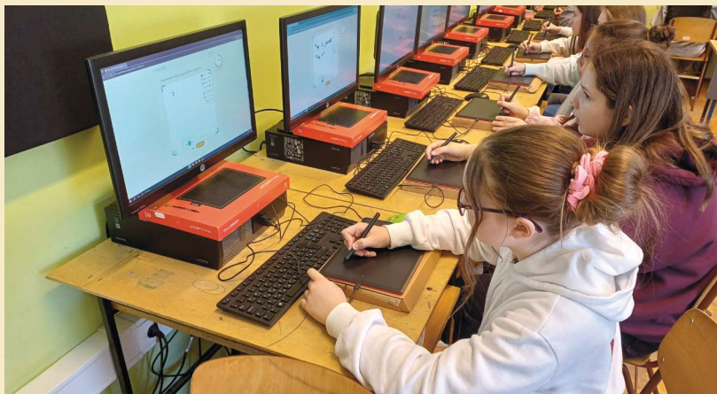
Auer-Németh Ildikó Adonyi Szent István Általános Iskola és AMI

beszerzése is, hiszen ezzel immár az iskola összes tanterme digitális táblával felszereltté vált. Ez a fejlesztés nemcsak az oktatás színvonalát emeli, hanem hosszú távon határozza meg tanulóink digitális felkészültségét.