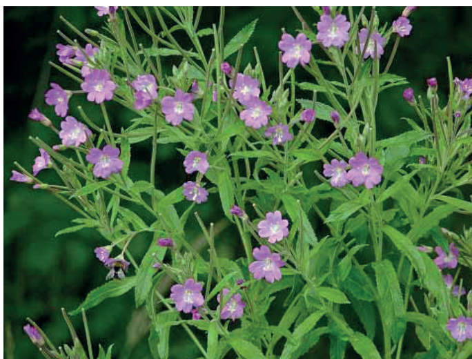
Kisvirágú füzike - Forrás: www.biokiskert.hu